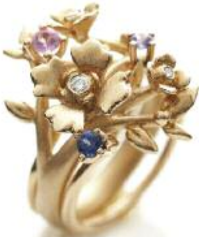
678 + 706 + 707